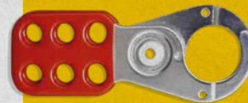
SKU0001165 Pinza multiplicadora 25mm