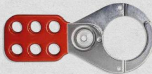
SKU0001159 Pinza multiplicadora 38mm