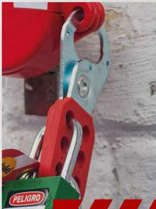
Bloqueo y Etiquetado